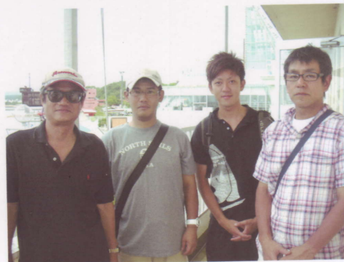
優勝した流星VIのメンバー

リュウセイ6は第1レースはマークタッチ、第3レースにはリコールをしてしまいましたが...なんと棚ぼた優勝してしまいました。