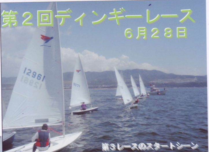
第3レースのスタートシーン