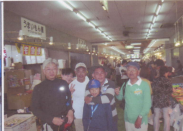
左：1階の青空市場でお買い物