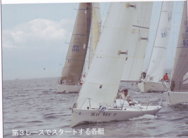
第3レースでスタートする各艇