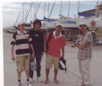
優勝したグラシャスのメンバー

今回も参加艇の少なくBクラスはグラシャスだけと言う事で、Aクラスに入れてもらっての参加となる。レースの楽しみは人によってそれぞれ違うが、私は戦った事のない艇とか海域でのレースを楽しむみとしている為、参加艇の減少はなんとも残念である。コミッティの2艇分を参加にまわしコースをシンプルにして淡パト1艇2~3人のボランティアで運営とか近くの堺とか関空近辺のヨットクラブと合同のレースが出来ると活性化するのでは？