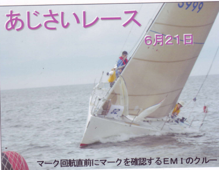
マーク回航直前にマークを確認するEMIのクルー