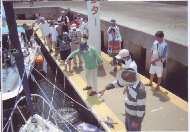
下：献花と冷たいビールを注いで工作中亡くなった仲間の冥福を祈った