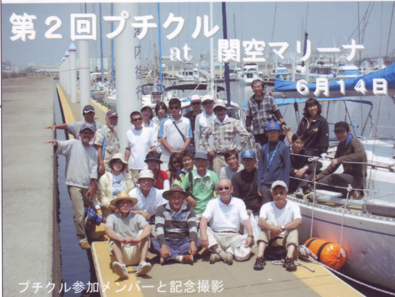
プチクル参加メンバーと記念撮影