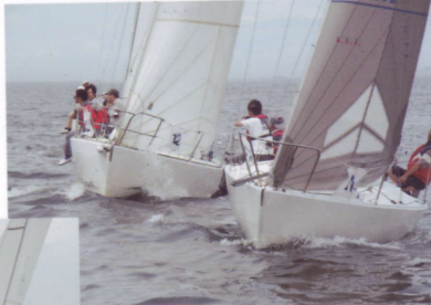
スタートするFAIRY4と TWO TON