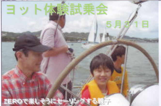
ZEROで楽しそうにセーリングする親子

5月31日にマリーナ協会主催のヨット体験試乗会が行なわれ、クラブからは10艇、ディンギー3名が協力しました。